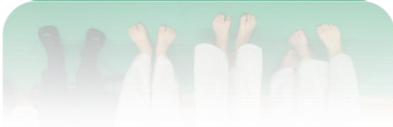
In alto con il Campione d'Europa di kata Mattia Busato