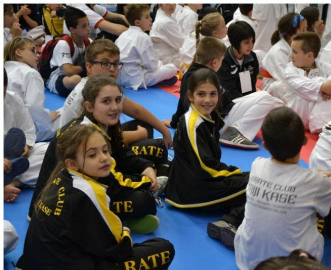
Le atlete in un momento di relax