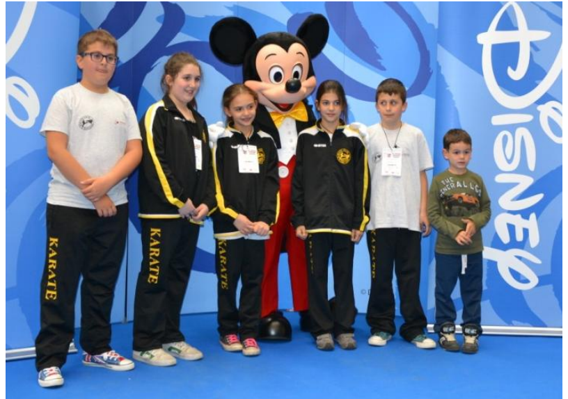
Foto ricordo con Topolino

L'evento è stato arricchito dalla presenza di un villaggio Disney allestito all'esterno del palazzetto, dove era possibile incontrare i disegnatori di Topolino ed i truccatori ufficiali Disney. I piccoli atleti hanno avuto modo di conoscere il mondo Disney nel villaggio appositamente allestito a fianco al palazzetto di gara, fare foto ed avere in regalo gadget firmati dall'autentico Topolino